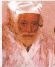
מרן הגר"מ שרעבי זצ"ל

פעם בא אל רבנו חיל אחד מוכשר מחיל האויר ונפשו חשקה לטקוב בתורה ולא להיות בצבא, והביאו אותו אל רבנו ואמר לו כי הוא לא יכול להיות בצבא עם כל הפריצות שיש שם והוא רוצה ללמוד בישיבה תורה. רבנו עמד והרהר זמן מה ואמר לו "פטיור ועטירי". מאותו יום לא היה משתף אותו חיל פעולה אלא רק היה אומר תהלים. המפקד קרא אותו לדין לפני השופט וכשישבו שם דיבר השופט עם כמה מהסגנים שלו באנגלית ואמר אם נשאל אותך שאלה פלוגות יענה כן זה סימן שהוא משוגע ונפטור אותו, ואם הוא יענה אחרת זה סימן שהוא רץ עושה הצגות. ואותו חיל הבין מה שהוא אמר כי לא ידעו שהוא מבין אנגלית ואז ענה את התשובה שהיה צריך לענות אם הוא משוגע ופטיור אותו מהצבא. ובה"ה היום הוא מורה הוראות ות"ח חשוב. חיל אחר שלא רצה להמשיך לשרת בא לפני רבנו ובקש להשתחרר ורבנו הורה מעט ואמר לו יהיה טוב (ולא אמר לו פטיור ועטירי) וחיל זה גם הצליח לברוח מהצבא, ולא תפסו אותו רק לאחר עשר שנים כאשר רבנו נפטר אז תפסו אותו ולקחו אותו לצבא. וזה היה ידוע כי שזכה שיאמר לו רבנו "פטיור ועטירי" לא היו תופסים אותו כלל ועיקר. (המקובל הגר"ב שמואלי שליט"א בספרו על הרב זצ"ל)