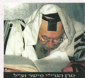
מרן הגר"י פישר זצ"ל הציטטא ימים כבישירי טומאה ומכשירי טומאה

אחד מגדולי צדיקי הדור שליט"א שריד פליטת ישראל סבא איש לזעוק מרה: האש בוורת! לא מעטים ממטאים עיניהם ברפש וטיט ומדרדרים לחתינות, ואנה אנו באים? צריך לעצור מיידית את כל המחלוקות ולהרעיש תבל ומלואה על הצרה העיקרית, והיא: להתרחק מכל מכשירי הטומאה וכל דבר היפך הקדושה, בשמים יש זעם גדול על כל וכן על המחלוקות הקשות בתוככי החודים לדבר ה' - סיים אותו גדול בכאב עצום את דבריו. ובזכות שנתרחק מכל דבר היפך הקדושה ומכל מחלוקת יאמר ה' לצרות ישראל די אמן.