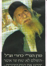
מרן הגר"י כדורי זצ"ל הישילם לא ינוח ולא ישקוט עד אשר יתקנו ישראל את העיניים