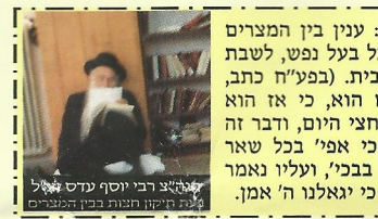
הגרי"צ רבי יוסף עדס זצ"ל לצד ריקון חנות בני העשרים

נתבקשנו לעורר בשם גדולים וצדיקים שליט"א המתחננים: אש המחלוקת מכלה מנפצת עד בשר. החס על נפשו וזדותו אחרי יתרחק מכל מחלוקת ורדיפת יהודים מכל צד שהוא.