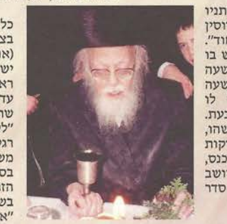
הסטייפלער עמד והמתין...

כל זה לא אניס ליה כל רז לא אניס ליה, בנגלה ובנסתר בצורה אשר כמעט ואין לה את רוע, (אם כי בנסתר עשה הכל לא ידעו כי אם לו יד בכך) שאלות מפורסמים ראשונים אחרונים. הידיעות שלו הגיעו עד הנושאים הכי רחוקים. למשל יהודי שחשש שיש לו נגע ויש שאלה של "קוץ בהרתו". הרב אלישיב הסתכל רגע על הנגע, הזכיר בו במקום כמה משניות, ובתוך רגע נוסף אמר לו: "הכל בסדר, זה לא נגע". ... מי כמעט דבור הזה היה יכול לפסוק על נגע וברגע... בשאלות של מציאות היה משיב מיד: "אם זה ככה וככה אז התשובה כך וכך".