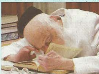
אהבת התורה עד כלות הנפש

צדיקים אין הקב"ה מביא תקלה על ידם היה זה לפני כעשרים וחמש שנה. הגיע יהודי אמריקאי, חרדי, שהזמין את הרב לחתונה של הבן. הרב תכנן ללכת אלישיב זצ"ל השיבו כי יש גמרא האומרת שרוב צדיק לשים לב בשאלות תמוהות מה התכוון בהם השואל ולא להשיב בהפזז. "שאלה זו גם היא נכללת בכך, ומאחר שהרב שחשב את התשובה שחכ את הכלל הבסיסי שרוב בישראל צריך לנהוג בדרך זו, מוטל עליו לצאת, לחפש את השואל ולתקן את הדברים כדי שלא יחלל שבת בגללו". צדיקים אין הקב"ה מביא תקלה על ידם היה זה לפני כעשרים וחמש שנה. הגיע יהודי אמריקאי, חרדי, שהזמין את הרב לחתונה של הבן. הרב תכנן ללכת אלישיב זצ"ל השיבו כי יש גמרא האומרת שרוב צדיק לשים לב בשאלות תמוהות מה התכוון בהם השואל ולא להשיב בהפזז. "שאלה זו גם היא נכללת בכך, ומאחר שהרב שחשב את התשובה שחכ את הכלל הבסיסי שרוב בישראל צריך לנהוג בדרך זו, מוטל עליו לצאת, לחפש את השואל ולתקן את הדברים כדי שלא יחלל שבת בגללו".