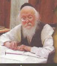
"הצרה הזו של הפאות" מלשון הגרי"ש זצ"ל