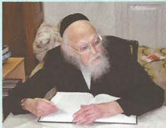
באהבתה ישגה תמיד