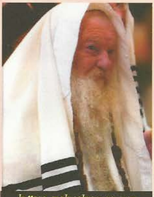
הרבי מלעלוב זצ"ל

המשב"ק ר' מרדכי ג. שליט"א מצוין כמה הוראות בחינוך הילדים אשר שמע מפ"ק של ק"ק הגה"ק הרבי מלעלוב זצ"ל: הדבר הראשון אותו הזהיר תמיד רבנו שעם ילדים יש ללכת אך ורק ב"טוב ונחת", והפסטר שהיום אנשים לא יודעים מזה, ופעם שמוצאן הדיור הוא אמר לו שהרי כתוב "והסוד שבטו שונא בנו" אמר לו מיד רבנו "לא מתכוונים לשבט הזה" ובל"ק: "נישט דעם שטעקן מיינט מען ולא יסף.