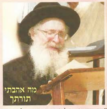
מה אהבתי תורתך