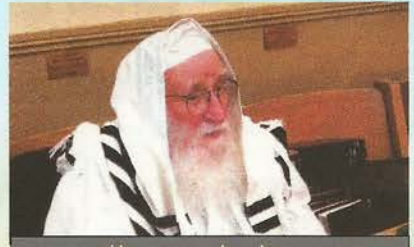
רבי חיים שטיין זצ"ל – כל הצרות הם בגלל חוסר קדושה