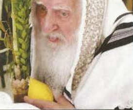
גאב"ד אונגוואר זצ"ל

חלל עולמנו נתרקן שוב מאחד ומיוחד מעמודי הדור האחרון, גאון אדיר ויהודי קדוש שריד לדור הקודם. מפורסם היה בגדולתו העצומה בתורה, עד כי היכן אשר היית שואלו היה משיב משל הרגע עסק בסוגיא זו, בקיאותו העצומה היתה מן הנדירות והבלתי מצויות. בניו מספרים על הש"ס וארבעת חלקי שולחן ערוך שהיו שגורים על לשונו בלשונם ובצורתם ממש. "כאשר לאבא היה קטרקט בעין ולא היה מסוגל לקרוא, הוא היה מצביע במקום המדויק בגמרא או בשולחן ערוך ונושאי כליו, ומצטט את לשונו. שומעיו לקחו לא ידעו מאומה, אך אנו ידענו שאינו קורא מהכתב, אלא מהזיכרון.