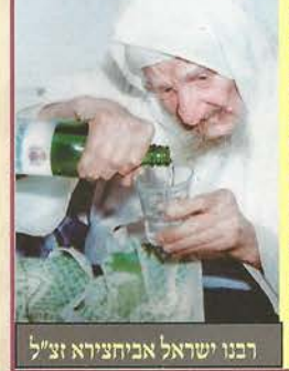
רבנו ישראל אביחצירא זצ"ל

איש החסד הר"ח ר' חיים כהן שליט"א מנהל ארגון "לינת החסד" העיד בפנינו דבר נחוץ וחשוב: זקן חשוב שליט"א שח לו לאחרונה כי שמע מפי"ק של הגה"ק רבי ישראל אבוחצירא זצ"ל, כי בדור זה לא פלני הגאולה יהיה בירור קשה מאד ויהיו נסיגות קשים, ואלו מן האנשים שיפסדו עצמם חזק בשמירת העינים ולא יגירו אחרי כל הסחי והמייאוס שיהיה בדור זה, הם חזיקו בעמדה, ויצטרכו להתפלל על כך חזק להוציל מכל הסתכלות בנשים וק"ו מראות אסורות. ואילו מן הנשים עיקר מבחנם יהיה בענין הצניעות ובכלל זה: ענין כיסוי הראש ויאלו שאלו כי יראו אז עין בעין כי כל ההבדל בן הנאמנים לה' וחלילה להיפך מוכן יהיה בענין הקדושה והצניעות, ואלו שיהוהו בכך יזכו לשמירה מיוחדת.