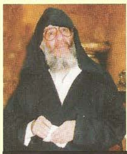
רבי אלעזר אביחצירא זצ"ל

המנונה הטהורה! - הרה"ק רבי אלעזר אביחצירא זצ"ל בני ברק יש את מרן החזון איש... בריאותו הנפשית של בחור ישיבה צעיר התדרדר עד שאושפז בבית חולים לחולי נפש כדי לקבל טיפול רפואי לצורך איוונו. האב, יהודי ת"ח התהדרר בבני ברק, נסע לברא שבזע וסיפר בכמה לרבי אלעזר על מצב בנו. אמר לו הצדיק: "אתה גר בבני ברק ומגיע אליי? בבני ברק יש את החזון איש. הוא המרא דאתרא. עלה על קברו, הדלק נר ואמור את הדברים הבאים: 'מרן הרי יודע בשחיבות של תורה בטהרה ובחשיבות של תורה במי הנעורים.