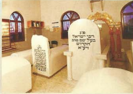
ציורו הקדוש של רבנו ישראל הבעל שם טוב זיע"א

פתח רבי אברהם וסיבר את אוניהם לאמור: "מענתה תדעו, כי הדמויות המצוירות על כרטיסי המשחק הטמא הלזה, אינן ציורים דוממים בעלמא, כי אם דמויות טמאות של "קליפות" קשות מצד הסטרא אחרא, רחמנא ליצלן; מני אז, לא ההין עוד אף תלמיד מבני הישיבה לשלוח את ידו אל כרטיסי מכרטיסי המשחק הטמא האלו, וגם ליתר בני הקהילה, אשר שמעו את אשר אירע בישיבה, היה הדבר ללקח מאלף, לאפרושי מאיסורא.