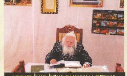
גאב"ד אונגוואר זצ"ל בצל סוכתו

בן מלך פנימה כן העיר על נשנים יוצאות בחור רבות ואפילו אם זה לשמחות. והיה אומר: התורה אסרה להילחם במואב אך התירה להתגרות בהם ולשלו אותם, ואילו בעמון אסרה אף את התגרותו והכל בשכר הצניעות של אם עמו יותר ממואב. ומבאר שצניעות האם הועילה לבני בניה לאחר ארבע מאות שנה שלא יצערו אותם בני ישראל. ולהיפך העזות קצת של הבכירה גרמה לבני בניה כמה התגרות וצער ויגון. ואע"פ שחז"ל אומרים שנתכוננו לשם שלמים, אעפ"כ כיון שבדבר אחד יכלה להצניע יותר ולא עשתה כן נענשו בניה אחיה. והגאב"ד כתב בזה"ל: "ומעשה האם משפיע על חיי בניה אפילו לאחר כמה דורות. והאם יתנת על ליבה כי כמה יגיעות מתייעגת לטובת בניה ומוסרת נפשה עד שמגדלת אותם ושבביל דבר קל יבלתי צנוע וכיו"ב תאבד הון ר' ויסבל ח"ו דורות אחריה והסרחון יהיה תלוי בה. ולהיפך אם תצניע יהיה זכותה גורם לבניה עד סוף כל הדורות" עכ"ל.