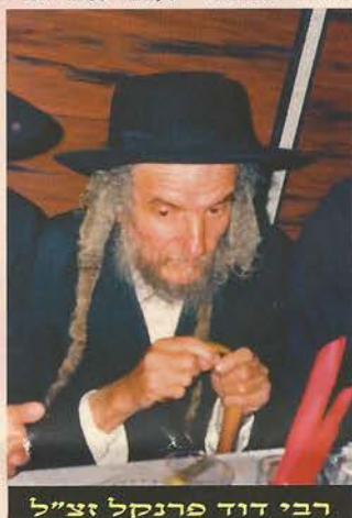
רבי דוד פרנקל זצ"ל

לפנינו עובדא מרגשת אותה סיפר במקלות עם בחול המועד פסח האי שתא הגה"צ רבי אלימלך בידרמן שליט"א (אנו מביאים את תוכן הדברים בקצרה): בירושלים היתה משפחה מסוימת אשר בנם גביל החמט הלך לשחק בגינת המשחקים הסמוכה לביתם. הלה החל להתנדנד בנדנדה כדרכם של ילדים, אולם מסיבה כל שהיא נקשר לו חבל הנדנדה סביב צווארו, ובהיעדר אנשים מבוזגים במקום מצבו הלך והסתבך עד אשר נחנק ומצבו היה קשה ביותר. הוא כמובן הובהל במהירות לבית החולים שם הוברר כי מצבו קריטי, ולאחר מאמצים רבים ספקו הרופאים ידיהם בייאוש, ולמרבה הצער נתפך הילד לצמח. ההורים ניסו לעשות ככל אשר אפשר הן בטיפולים והן בפניות לרבנים. אך הילד