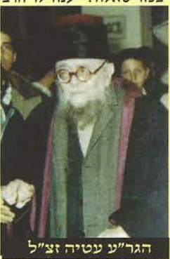
הגר"ע עטיה זצ"ל

באה ציפור ובנתה על ראשו קן... משה אמת ותורתו אמת! כשהיה מרן הגה"צ רבי עזרא עטיה זצ"ל במצרים, היה מוסר שיעור בגמרא בפני פקידים סוחרים ותעשיינים, כשהגיעו לסוגיית מצות שילוח הקן במסכת חולין, דנה הגמרא על הפסוק "כי יקרא קן ציפור לפניך בדרך בכל עץ או על הארץ", מה יהיה הדין אם ימצא קן על ראשו של אדם? כששמע זאת אחד הלומדים, תמה: "איזו מין שאלה לא מציאותית זו! מדוע עוסקת הגמרא בכזו שאלה?" ענה לו הרב