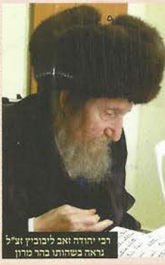
רבי יהודה זאב לייבוז'ין זצ"ל נראה בשנותיו בהר מרון

אלא שהגה"צ רבי דן שליט"א אף תומך באופנים שונים, ומזוהר ומעודד את העוסקים בכך שלא על מנת לקבל פרס, אשריהם ואשרי חלקם! לא לערוך את הקידוש... - עד שיהליפו את המאה למטפתה ושה בפניו הרב אהרן שטרן שליט"א: הגאון הקדוש רבי יהודה זאב לייבוז'ין זצ"ל אשר התגורר בביתו בעשר שנותיו האחרונות עלי אדמות. היה מקפיד מאד בכל ליל שבת לפני הקידוש, כי מי מבנות המשפחה, ההולכות בפאה נברית, וירידו המאה וילכו במטפחת. וללא זה לא הסכים שיעשו קידוש. וכשאמרתיו לו שמדובר בפאה גנועה. נענה ואמר: מה הבלבול בין פאה לשיער...? בנות ישראל! - חסדי ה' ישנה התעוררות גדולה בקרב המוני נשים בכל ענייני הצניעות, אולם מאידך גיסא, המצב בחלק מן ציבור הנשים אינו כפי טוב, ועליכן נפלה חובת השעה, להציל את בנות ישראל מאותן מלבושים קצרים וצרים וכל סוגי הפאות למינהן, אשר כל זאת נלמד מן השפלים שבאומות, ואם לא נחשוב על עצה כיצד להציל את אותן המוני נשים מרדת שחת, אנא אנו באים! ומה יזא בערו כמה שנים?