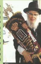
לולי תורתך שעשועי