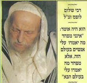
רבי שלום לופס זצ"ל הוא היה אומר: איני מפחד מה יאמרו עלי אנשים בעולם הזה, אלא מפחד מה יאמרו עלי בעולם הבא!

סיפר הגה"צ רבי יצחק זילברשטיין שליט"א: הגה"ק רבי שלום לופס זצ"ל היה מעורר רבות במעלת תפילת ותיקין, ושגורים היו על לשונו דברי הגמרא האומרת, כי אדם המתפלל בנץ, לא ינוק כל אותו היום. אחד הבעלי בתים בקהילתו, ששמע את הדברים, החליט לבוא ולהתפלל ותיקין, הוא קשר את הסוטה שלו עם הירקות, ליד בית הכנסת, ונכנס להתפלל ב"הנץ", בהיותו בוטח בדברים ששמע שלא ינוק כל אותו היום. והנה לאחר התפילה, יוצא הירוק החוצה, ו...שוד ושבר. הסוטה נגנבה. הוא חזר אל רבי שלום לופס שהיה בבית הכנסת, ומספר לו