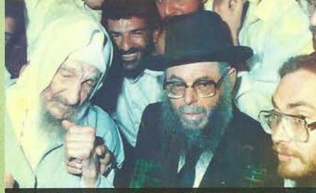
ראש הישיבה זצ"ל עם הגה"ק הבבא סאלי זצ"ל