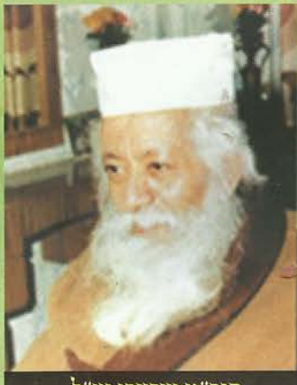
הגה"מ שרעבי זצ"ל

דקות וכשיצא אמר לו: תחילת כל, לך ועוד את אחיך ואמרו לו שלא ידאג. כי בעוד שלושה ימים ושנתה מצב הילד לטובה והוא יחלים. ולרפואתו, מוטב שיעטפו את ראשו בסדין ואז ירוחו לו. בשמוע האח את דברי רבנו המבטיחים ומפורשים את חיי הילד רץ בשמחה והודיע את בטלפון לאחיו שניצב ליד מיטת חליו של הבן. ואכן דברי התקיימו במלואם. לאחר שעטפו במלואם את ראש הילד בסדין הטוב לו והוא חזר להכרות, הרופאים התפלאו מאוד לראות את השינוי הדרסטי שחל במצבו של הילד ומילאו את חובתם הרפואית. הם טיפלו בו וכעבור זמן מה נשלח הילד לביתו.