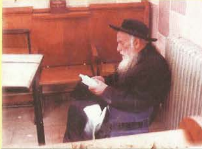
מרן הגר"ש אויערבאך זצ"ל נראה בהתאבלו על חורבן הבית...